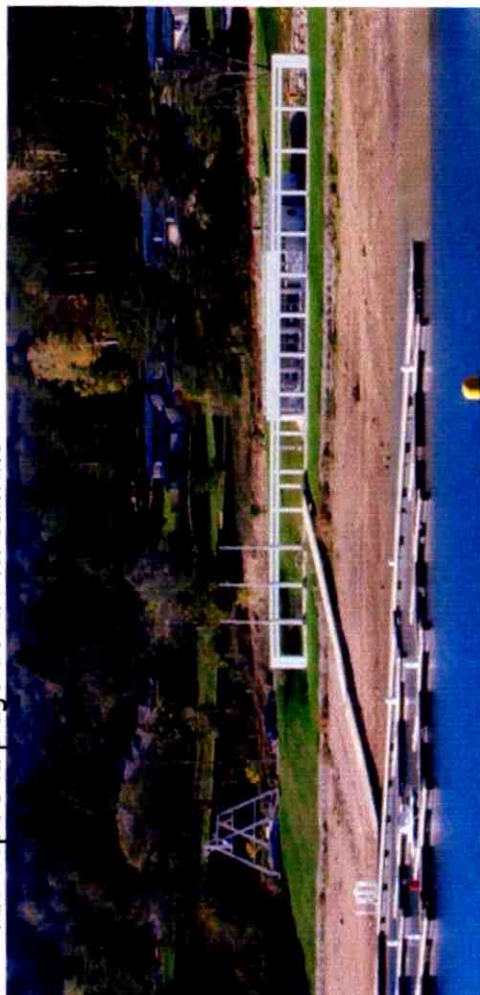
La Capitainerie vue depuis la Plage de la Mercantine