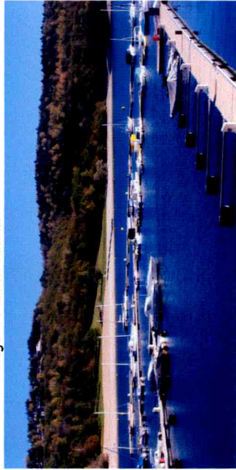
Vue de la Mercantine depuis la Rive d en Face