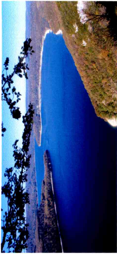
Vue d en haut et légèrement rapprochée de la Mercantine