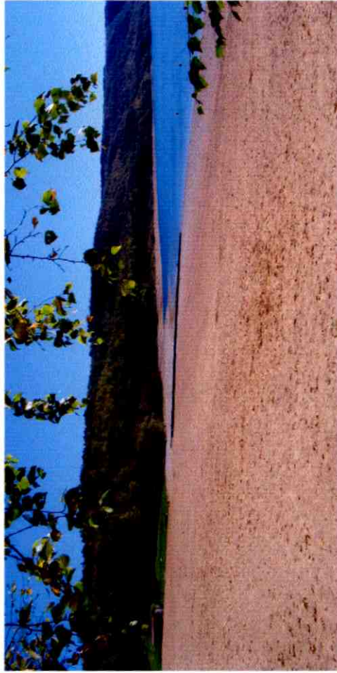
Plage de la Mercantine