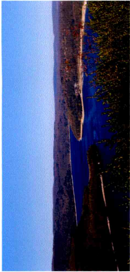
Vue d en Haut lointaine de la Mercantine